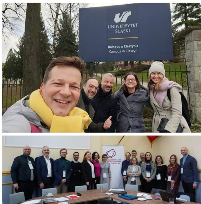
Mezinárodní setkání ombudsosob

Ombudsmanka se též podílí na připomínkování dalších interních dokumentů a předpisů, ve sledovaném období se jednalo především o novelizaci opatření rektorky o celouniverzitní ombudsmance.