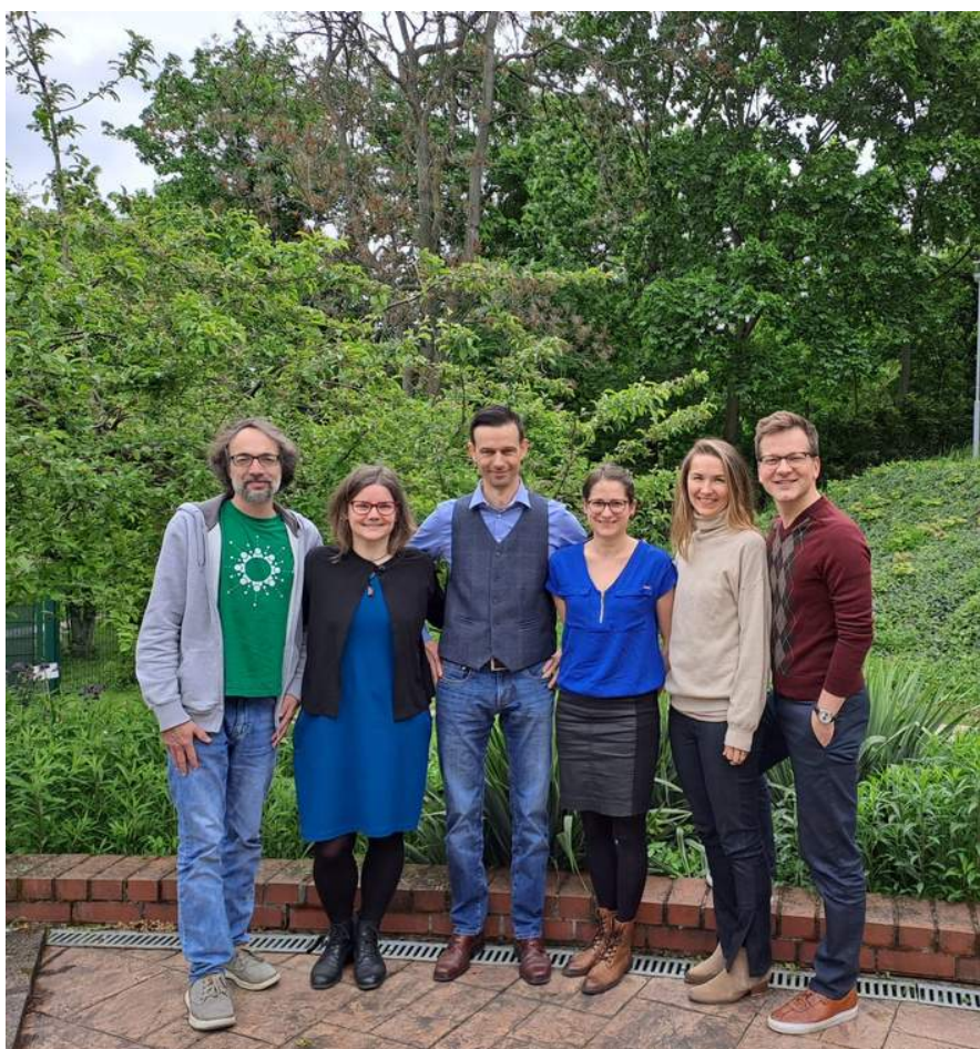
Schůzka zakládajících členů a členek Školské ombuds platformy

Ombudsmanka poskytuje podporu pro studující, zaměstnané a pracující osoby na fakultě i vedení fakulty, věnuje se též prevenci a nastolování bezpečného a podporujícího akademického prostředí, a vzdělávání. Činnost kanceláře ombudsmanky se ve sledovaném období soustředila především na přijímání a vyhodnocování oznámení týkajících se problematického jednání, dalšími činnostmi byla preventivní a informační činnost, vzdělávání, síťování, příprava doporučení k praxi či interních předpisů.