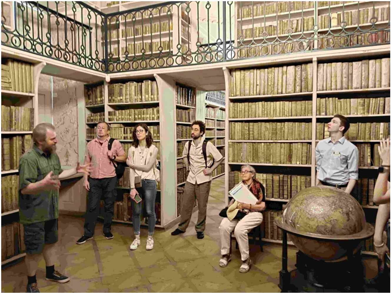
exkurze v Nostické knihovně