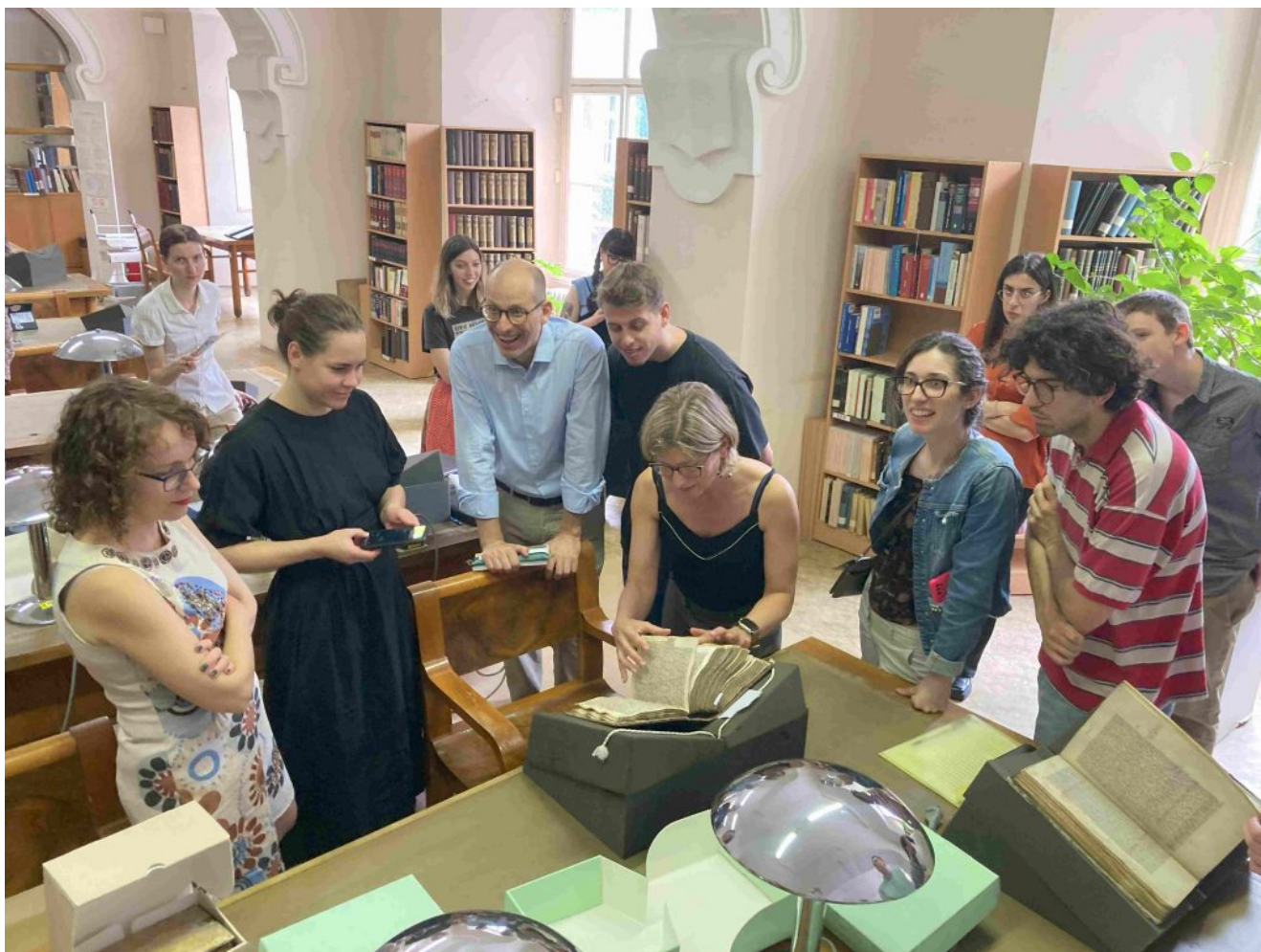
studenti programu BIP v Národní knihovně