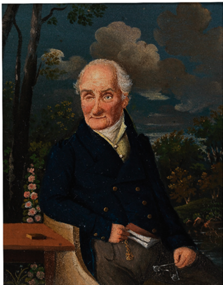
Dvorní lékař Anton Frölich (1760–1846), od roku 1824 šlechtic von Frölichsthal