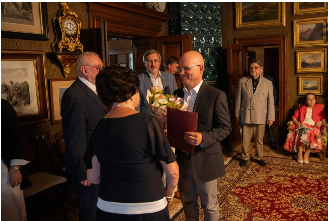
Cena Josefa Hlávky