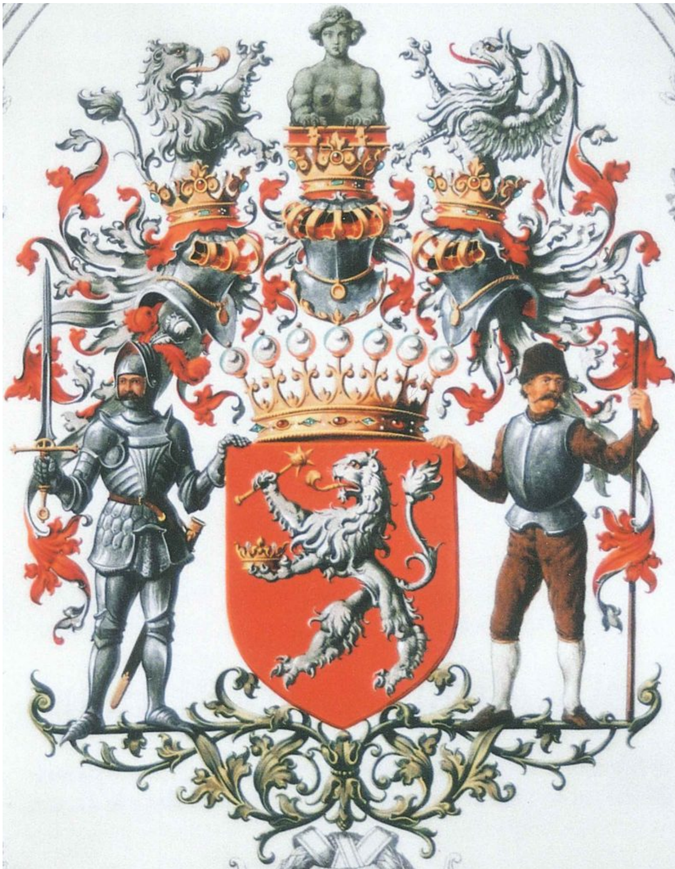
Erb svobodných pánů Riegerů (1897)