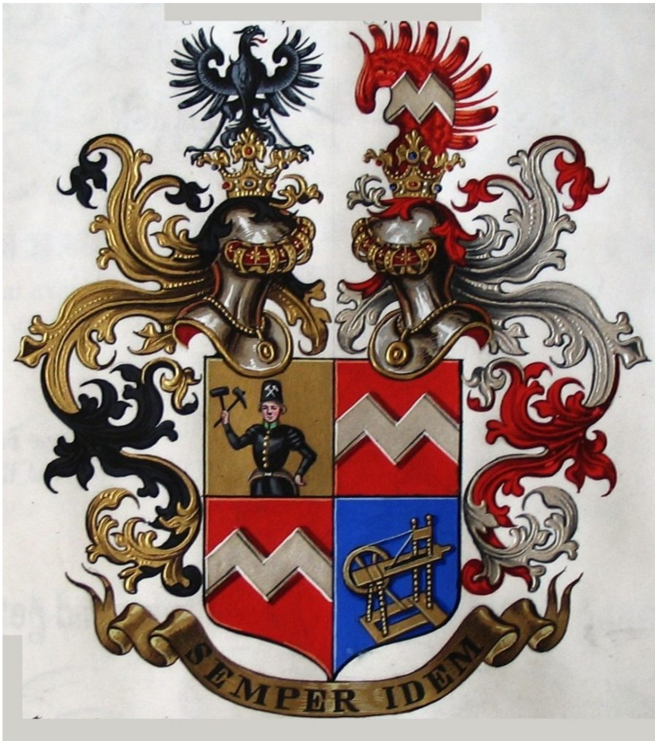
rytířský erb Nádherných z Borutína (1865)