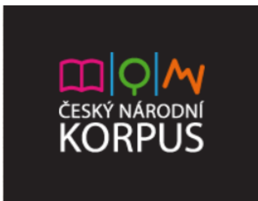
Český národní korpus

CDH také vytváří podmínky pro koordinaci tvorby a sdílení dat, přípravu grantů a projektů, snaží se o uznání specifických typů výstupů digital humanities ve vědeckém i celospolečenském prostředí a zprostředkovává výsledky vědeckého výzkumu širší odborné i laické veřejnosti. Podporuje také výuku v oblasti digital humanities v současných studijních programech a kurzech celoživotního vzdělávání a organizuje kurzy pro studenty univerzity, účastníky kurzů celoživotního vzdělávání a širokou veřejnost.