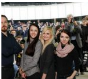
city října 2019

Ústav translatologie FF UK je od roku 2001 členem prestižního evropského Konsorcia EMCI (European Masters in Conference Interpreting), ve kterém je v současné době zastoupeno patnáct univerzit, včetně belgické Universiteit Antwerpen, ELTE University v Budapešti, ESIT – Université Sorbonne Nouvelle Paris 3 nebo SCIT – Herzen University v Petrohradu. Univerzity jsou zapojeny do společných projektů a dodržují definované standardy kvality a rámcové studijní plány pro přípravu budoucích konferenčních tlumočnicků.