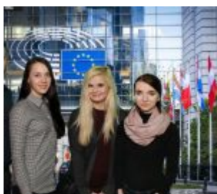
city října 2019