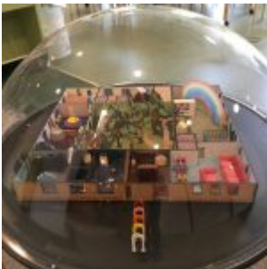
Model celého oddělení pro nejmenší čtenáře