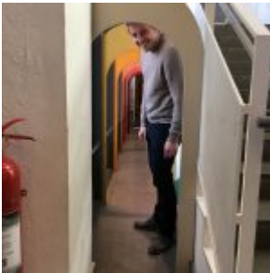
Vstup pro nejmenší čtenáře – Malmö Stadsbibliotek