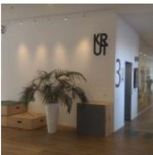
Krut – Malmö Stadsbibliotek