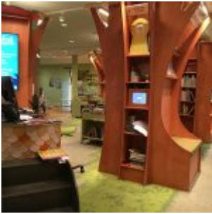
Kanini – Malmö Stadsbibliotek