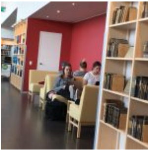
Univerzita v Malmö – knihovna Orkanen