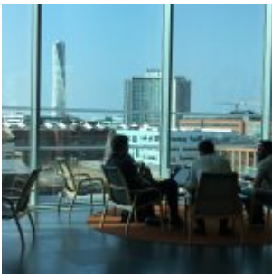
Místa s výhledem na dominantu čtvrti Västra hamnen, obytný dům Turning Torso