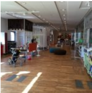
Balagan – Malmö Stadsbibliotek