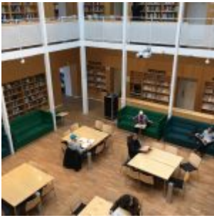
Interiér v původní budově městské knihovny není o nic méně pěkný a prostorný