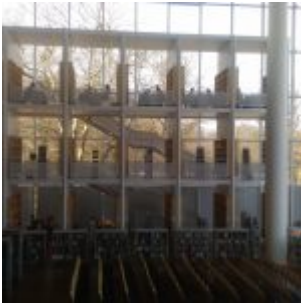
Krásný a velkorysý interiér městské knihovny