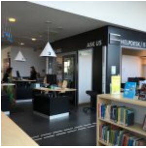
Univerzita v Malmö – knihovna Orkanen