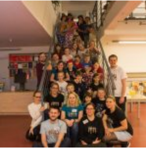
Pyžamová fotka na závěr.