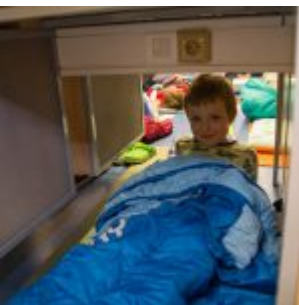
nebo pod stoly, kde se tak pěkně spí.