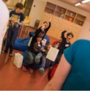
Vítězné družstvo modrých.