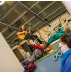
Než se zalezlo do spacáků