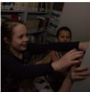
Konečně sklad. Víc fotek tam nevzniklo: byla tam totiž černočerná tma. Ale houkaly tam sovy!