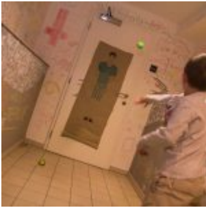
Záchrana Jarky Metelky (tady tedy vyfoceno ještě před záchranou)