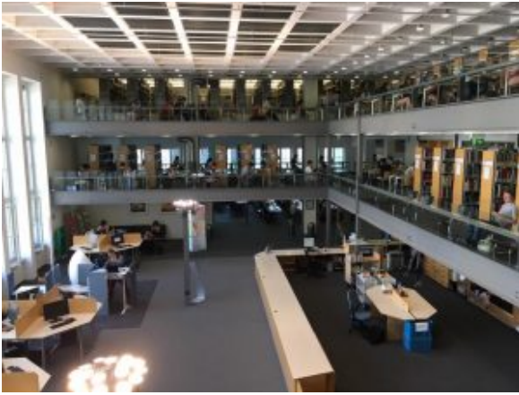
Největší knihovna Technické univerzity Mnichov. (Teilbibliothek Stammgelände, TUM)