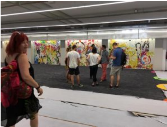
Tady všude byly regály s knihami, ale teď tu budou další studijní místa. (Teilbibliothek Stammgelände, TUM)

Nejprve jsme si prohlédli největší univerzitní knihovnu Teilbibliothek Stammgelände v centru Mnichova. Ta má víc než tisíc studijních míst a na dalších se pracuje, v části knihovny, kde dříve býval volný výběr, právě probíhala přestavba na další studijní místa a to jak běžná, tak také skupinová a individuální. Více než police s knihami potřebuje univerzitní knihovna právě různorodá studijní místa. Na dotaz kdo financuje nové knihovny a budovy univerzity, jestli to