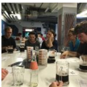
Pauza na dočerpání sil a vymýšlení taktiky pro týmový souboj