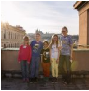
Družstva se svými „maminkami“