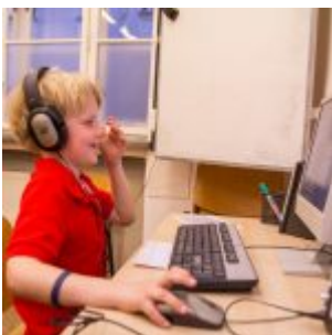
Mít hlas jako Fifinka...