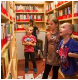
Hledání knih podle indicií