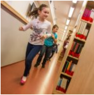
S větrem o závod