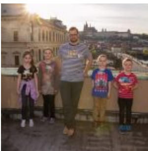
Družstva se svými „maminkami“