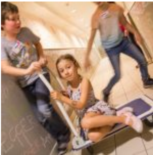
S větrem o závod