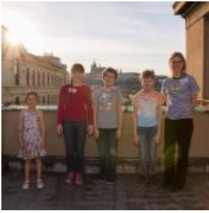
Družstva se svými „maminkami“