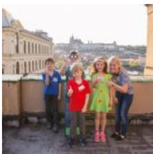
Družstva se svými „maminkami“