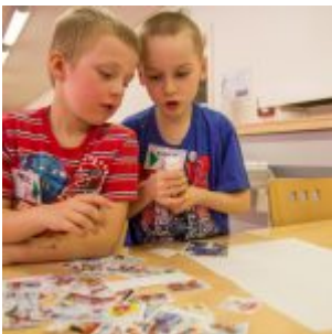
Kdo vyhraje nad lepidlem, vytvoří si vlastní komiks