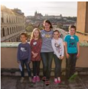
Družstva se svými „maminkami“