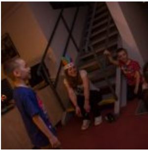
Jedinečná příležitost zažít ohýnek v knihovně