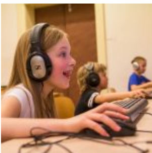
Mít hlas jako Fifinka...