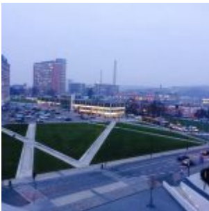
Výhled z budovy „U13“ Univerzity Tomáše Bati ve Zlíně