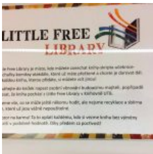
Little Free Library