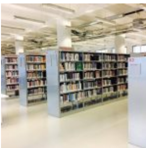
Prostory Krajské knihovny Františka Bartoše ve Zlíně