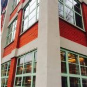
Jedna z továrních budov Baťovského areálu