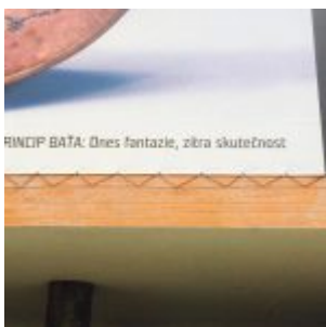
Expozice Princip Baťa