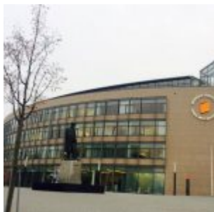
Knihovna UTB ve Zlíně