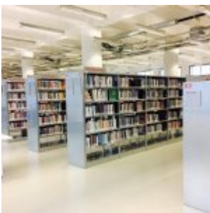
Prostory Krajské knihovny Františka Bartoše ve Zlíně