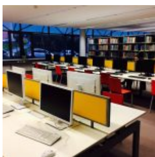
Prostory multioborové studovny UTB ve Zlíně