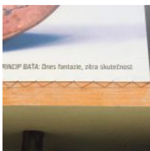
Expozice Princip Baťa