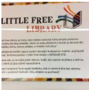
Little Free Library