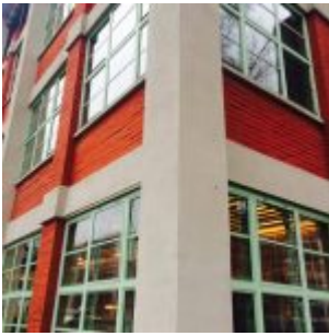
Jedna z továrních budov Baťovského areálu