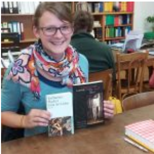
Workshop šití knižních obalů v Knihovně Ústavu germánských studií