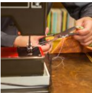
Workshop šití knižních obalů v Knihovně Ústavu germánských studií