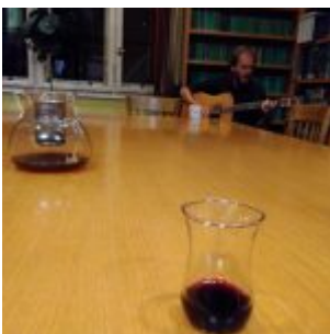
Jiří Dynda zpívá na kytaru a hraje své písně v Knihovně ÚFaR