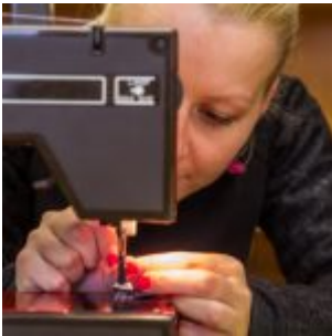
Workshop šití knižních obalů v Knihovně Ústavu germánských studií