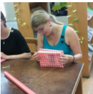
Workshop šití knižních obalů v Knihovně Ústavu germánských studií