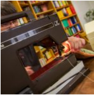
Workshop šití knižních obalů v Knihovně Ústavu germánských studií