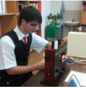
Workshop šití knižních obalů v Knihovně Ústavu germánských studií