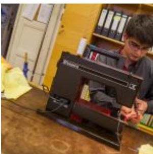
Workshop šití knižních obalů v Knihovně Ústavu germánských studií