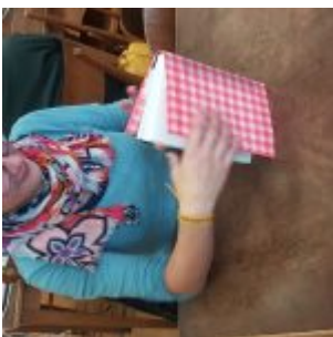
Workshop šití knižních obalů v Knihovně Ústavu germánských studií