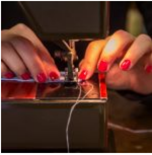
Workshop šití knižních obalů v Knihovně Ústavu germánských studií