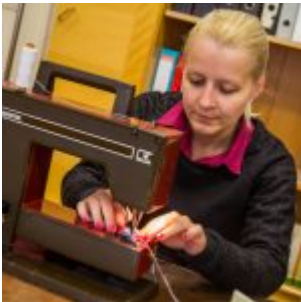
Workshop šití knižních obalů v Knihovně Ústavu germánských studií