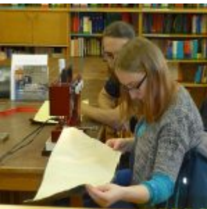
Workshop šití knižních obalů v Knihovně Ústavu germánských studií