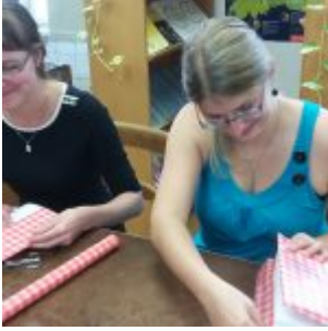
Workshop šití knižních obalů v Knihovně Ústavu germánských studií