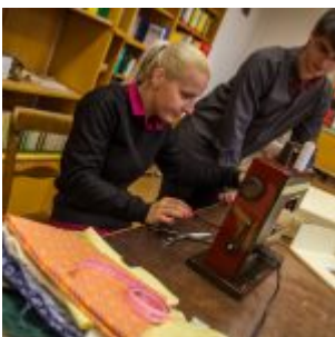
Workshop šití knižních obalů v Knihovně Ústavu germánských studií