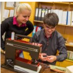
Workshop šití knižních obalů v Knihovně Ústavu germánských studií