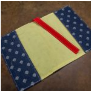
Workshop šití knižních obalů v Knihovně Ústavu germánských studií