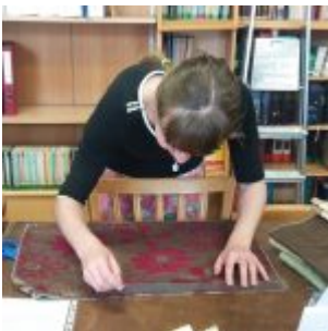
Workshop šití knižních obalů v Knihovně Ústavu germánských studií