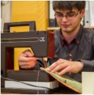
Workshop šití knižních obalů v Knihovně Ústavu germánských studií