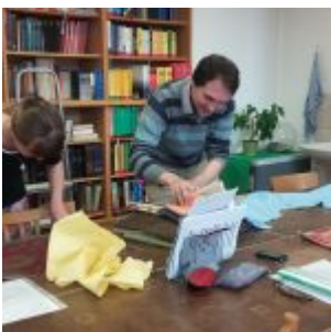
Workshop šití knižních obalů v Knihovně Ústavu germánských studií