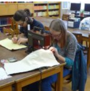
Workshop šití knižních obalů v Knihovně Ústavu germánských studií