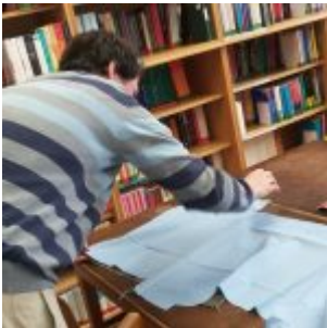
Workshop šití knižních obalů v Knihovně Ústavu germánských studií