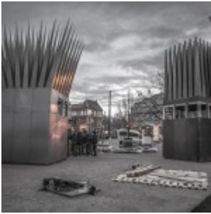
Montáž památníku.