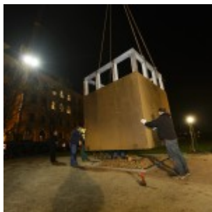
Montáž památníku.