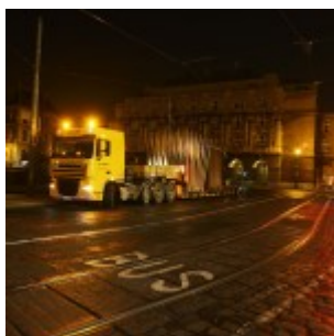
Montáž památníku.

Slavnostní odhalení či spíše představení pomníku veřejnosti za účasti mnoha zahraničních hostů a politické reprezentace připravuje Hlavní město Praha. Zcela jistě jde o mimořádnou událost, přinejmenším proto, že je to po dlouhých letech konečně hodnotná umělecká instalace ve veřejném prostoru, kterou iniciovala a realizovala sama Praha. Dílem Johna Hejduka je metropole obohacena o uměleckou intervenci světového významu srovnatelnou se stavbou Tančícího domu.