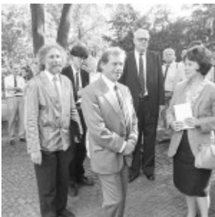
V popředí je Václav Havel s Shirley Temple-Black, za nimi John Hejduk.