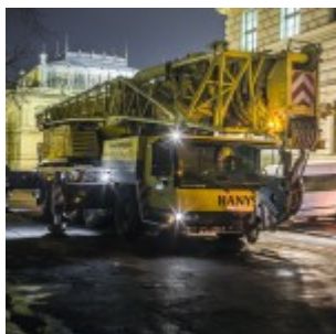
Montáž památníku.