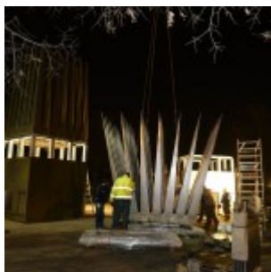
Montáž památníku.