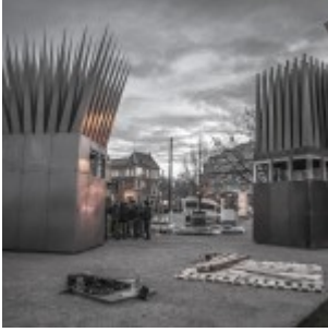
Montáž památníku.