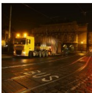
Montáž památníku.

Slavnostní odhalení či spíše představení pomníku veřejnosti za účasti mnoha zahraničních hostů a politické reprezentace připravuje Hlavní město Praha. Zcela jistě jde o mimořádnou událost, přinejmenším proto, že je to po dlouhých letech konečně hodnotná umělecká instalace ve veřejném prostoru, kterou iniciovala a realizovala sama Praha. Dílem Johna Hejduka je metropole obohacena o uměleckou intervenci světového významu srovnatelnou se stavbou Tančícího domu.