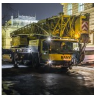
Montáž památníku.