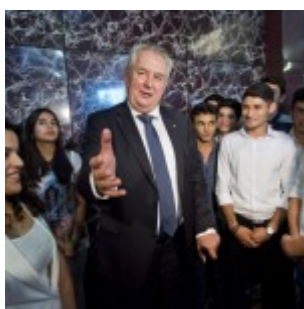
Prezident Zeman s ázerbájdžánskými studenty v Baku

Během návštěvy prezidenta v Baku byl předán Českému centru Bakuské slovanské univerzity knižní dar Filozofické fakulty UK; studentům češtiny jsou určeny učebnice českého jazyka a jejich učitelům bohemistické a didaktické práce (autorů především z Ústavu bohemistických studií a Ústavu českého jazyka a teorie komunikace), které vydalo nakladatelství Karolinum a vydavatelství FF UK.