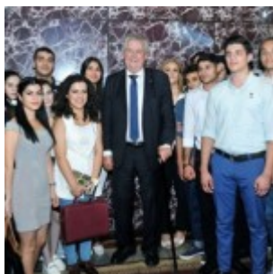
Prezident Zeman s ázerbájdžánskými studenty v Baku