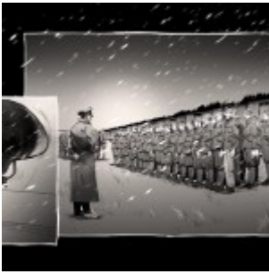
(c) Československo 38–89