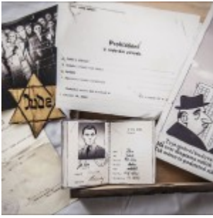
(c) Československo 38–89