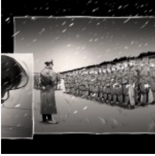
(c) Československo 38–89