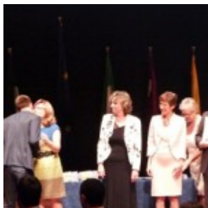
Předávání diplomů Evropské maturity při proklamaci na EŠ Lucemburk I.