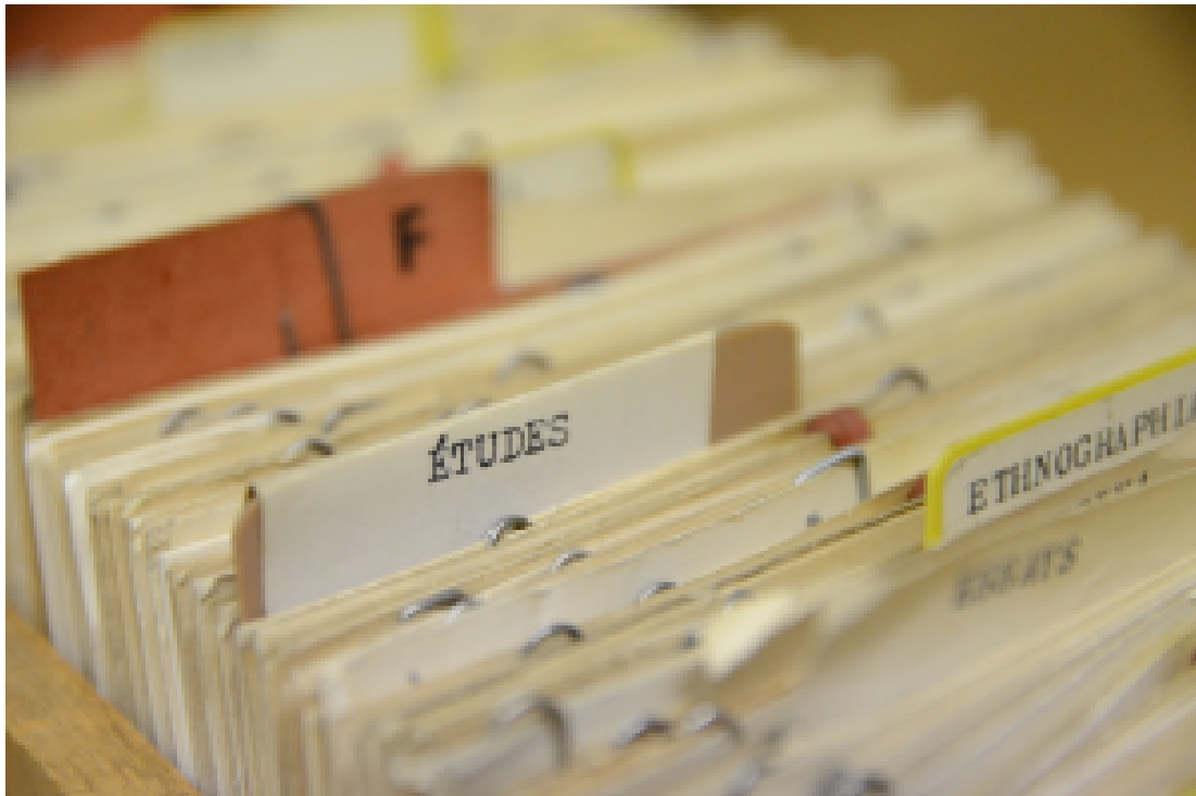
Lístkový katalog před retrokonverzí bibliografických záznamů

Rok 2015 se nese ve znamení dvou významných projektů. Prvním je skenování obsahů a obálek. Od února 2015 Knihovna FF UK skenuje obálky svých knih, které dodává do Centrálního katalogu UK, čímž zvyšuje komfort čtenáře při výběru hledané literatury. Velkým a významným projektem je spuštění projektu skenování a OCR zpracování obsahů knih, který zatím běží v testovacím režimu. Cílem projektu je obohatit bibliografické záznamy o obrázky i textovou podobu obsahů knih. Uživatel tak nově bude mít možnost vyhledat dokument i pomocí zadání např. názvu stati či kapitoly odborné knihy. Projekt by měl v průběhu roku 2015 přejít do ostrého provozu, v němž budou tímto způsobem zpracovávány všechny nově nakoupené knihy, výběrově pak i starší část fondu.