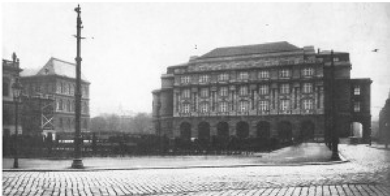
Budova filozofické fakulty po dostavbě v roce 1929

románského semináře (1902), knihovna filozofického semináře (1905), knihovna semináře klasické archeologie (1905), knihovna ústavu pro dějiny umění (1905), knihovna anglického semináře (1912) a další. V roce 1929 se tyto knihovny přestěhovaly do novostavby hlavní budovy fakulty na tehdejším Smetanově náměstí (později Krasnoarmějců, dnes náměstí Jana Palacha).